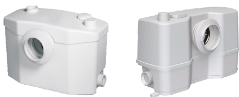
КАНАЛИЗАЦИОННЫЕ УСТАНОВКИ SFA И GRUNDFOS