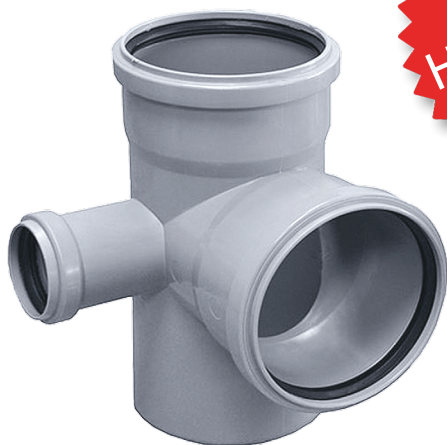
Крестовины угловые 110/110/50*87° левая и правая