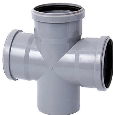
Крестовины 110/110/110*87° 110/110/110*45°